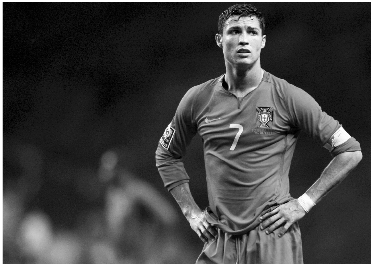
Will sich am 12. August an Liechtenstein revanchieren: Super-Star Cristiano Ronaldo spielt erneut in Vaduz.

Fünf Jahre nach seinem ersten Auftritt in Vaduz kehrt Ronaldo zurück. Der 24-Jährige beschert dem Liechtensteiner Fussballverband damit ein Geschenk der besonderen Art. Das Jubiläums-Länderspiel zum 75. Geburtstag des LFV wird – wie üblich – vor allem seine Bühne werden, doch dürfte es auch für alle Zuschauer und für die Liechtensteiner Nationalspieler ein ganz spezielles Ereignis werden. Dies nicht zuletzt deshalb, weil